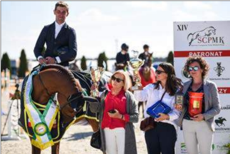
Dekoracja czempiona koni 4-letnich