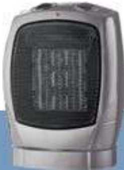
GRZEJNIK CERAMICZNY PTC-1508A 99,99 zł