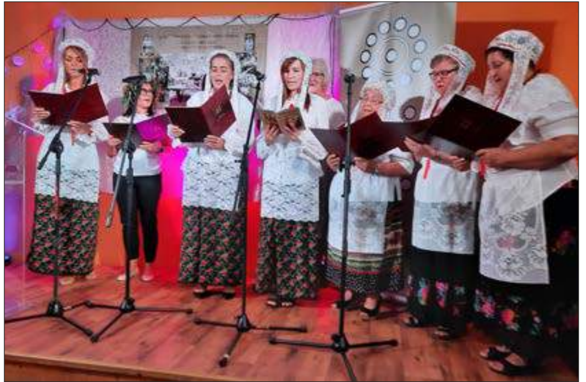
Od przeszło pół wieku spotykają się, aby wspólnie pielęgnować regionalne obyczaje. W tradycyjnych, barwnych strojach, prezentują swoje kulinarne zdolności i śpiewają ludowe przyśpiewki, czym uświetniają lokalne wydarzenia

A o dobry humor uczestników zadbała Grupa Fest, która w kabaretowym stylu sypała żartami po śląsku.