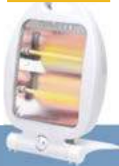
GRZEJNIK KWARCOWY 2 ustawienia grzania 39,99 zł