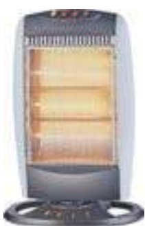
GRZEJNIK HALOGENOWY 3 ustawienia grzania - 89,99 zł/szt.